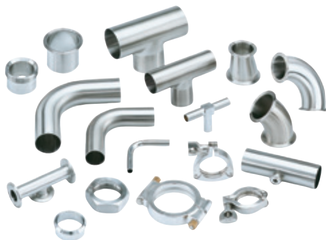
Wir haben das richtige Produkt für Sie, damit Sie keine Zugeständnisse in Sachen Prozessqualität machen müssen.

Durch maschinelles Senkrechtschneiden kann das Plansenken optimal durchgeführt werden. Dadurch wird höchste Exaktheit und Konsistenz beim Orbitalschweißen erreicht. Alle Fittings durchlaufen eine visuelle Kontrolle. Unebenheiten und Rechtwinkligkeitstoleranzen werden zudem mit kalibrierten Geräten überprüft. Die Oberflächengüte jedes Produktes wird mit einem kalibrierten Oberflächenmessgerät überprüft, um die durchschnittliche Rauheit (Ra) zu messen.