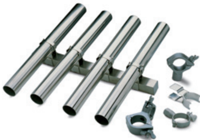
Wir haben für jeden Hygieneanwendungsprozess das richtige Rohr.

Die Rohre erfüllen höchste Anforderungen an Material, Hygiene und Herstellungsgenauigkeit und werden nach DIN 11866, ASME BPE, ISO 2037 und BS 4825 gefertigt.