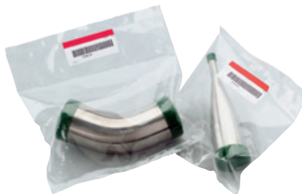
Tri-Clover BioPharm Rohre.

Von Alfa Laval können Sie alle Spezialrohrleitungen und Halterungen für Anwendungen im biotechnischen und pharmazeutischen Prozess beziehen. Qualität und Oberflächengüte der Tri-Clover BioPharm-Produkte sind exakt auf die Anforderungen dieser Industrie abgestimmt. Egal, welches Montagematerial Sie benötigen: Wir haben das richtige Produkt für Sie, damit Sie keine Zugeständnisse in Sachen Prozessqualität machen müssen.