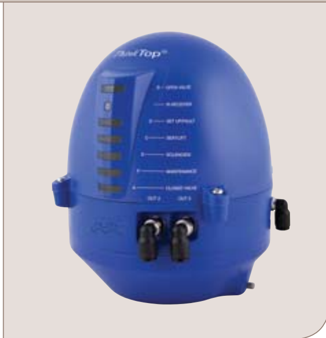
Fernbedienung ohne Demontage des Steuerkopfes durch.